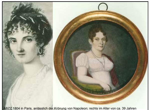
ABZZ, 1804 in Paris, anlässlich der Krönung von Napoleon; rechts im Alter von ca. 39 Jahren